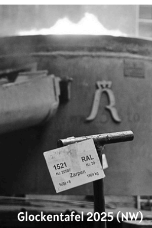
Glockentafel 2025 (NW)