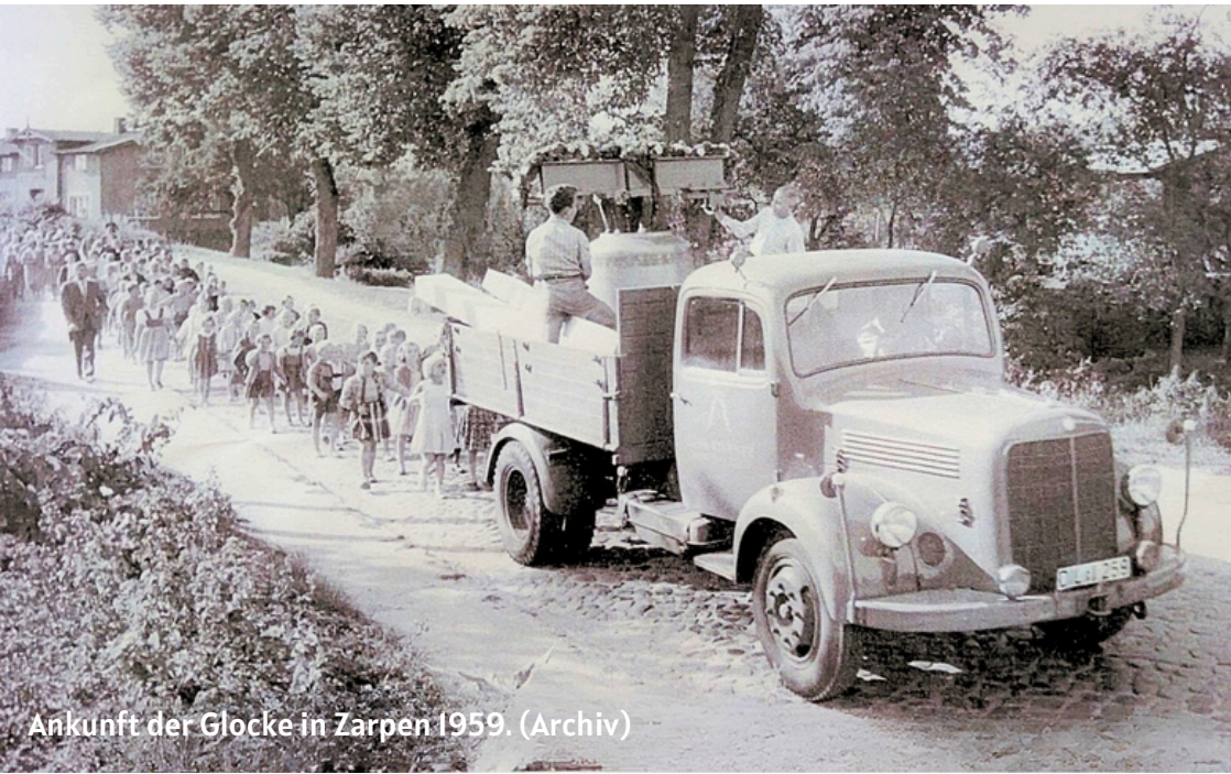
Ankunft der Glocke in Zarpfen 1959.

SIEHE / ICH VERKÜNDIGE EUCH GROSSE FREUDE! +