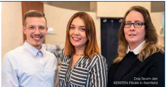
Das Team der KERSTEN-Filiale in Reinfeld